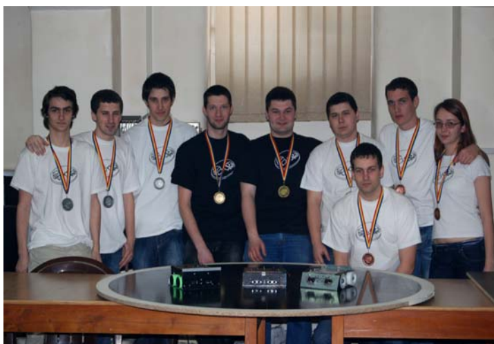
Câștigătorii BattleLab Robotica 2011