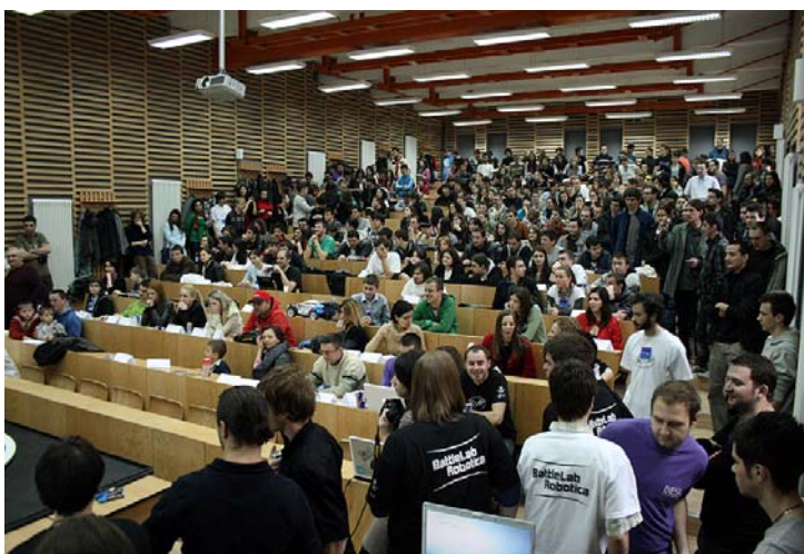
Sala P03, sâmbătă 19 martie 2011, în timpul competiției