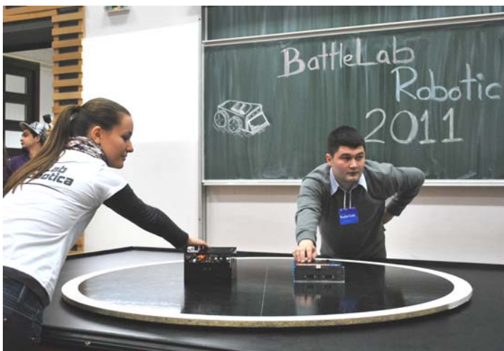
Bazinga vs. MEX, meci de sumo din grupele de calificare